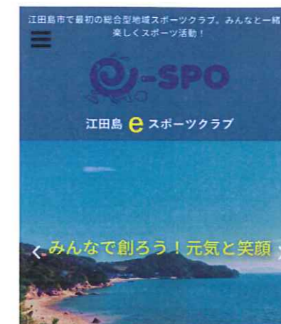
新しいHPのトップページです。