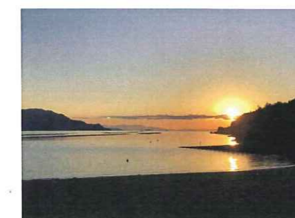
長浜からの夕日もとってもキレイです

次回は2月26日(金)9時15分～の予定です。参加希望の方は、事務局までお知らせください。